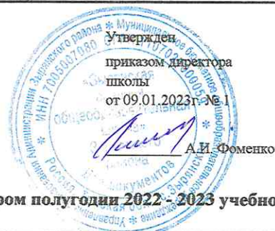
График проведения оценочных процедур в 1-11 классах во втором полугодии 2022 - 2023 учебном году